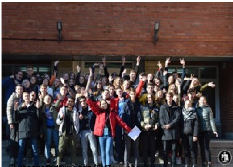
«Семья» в честь Дня Победы в Сталинграде